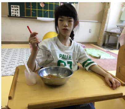
トマトをつぶして～★