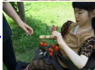
「調理実習」 ～野菜のピューレ～